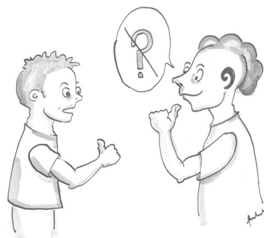
Illustration 48: Vérifier que la personne vous comprend

Il est important que votre interlocuteur voie que vous êtes concentré sur la conversation.