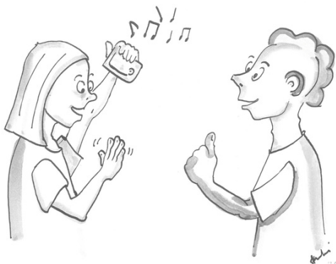
Illustration 49: Interruption par la sonnerie d'un téléphone portable

Expliquez l'interruption potentielle: Votre discours peut être interrompu par des événements qui peuvent se produire mais que l'interlocuteur malentendant n'est pas en mesure de remarquer. Il peut s'agir de la sonnerie de votre téléphone, de quelqu'un qui frappe à la porte, etc. Dans ce cas, faites-en part à votre interlocuteur. Si vous ne le faites pas, il pourrait penser que la conversation est terminée ou vous trouver impoli à son égard.