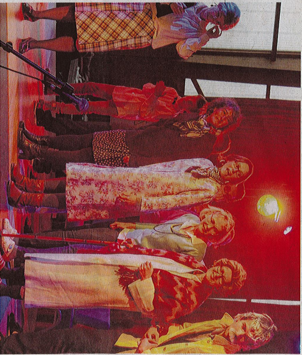
L'an dernier, les profs avaient rejoint sur scène les collégiens de l'atelier théâtre et ça avait plu au public.

En marge des différents spectacles, un village associatif sera installé. Seront présents des associations locales, le stand de l'atelier théâtre du collège, mais aussi le club de prévention de La Vie active, un des partenaires maîtres du festival. La nouveauté de cette année : un stand dédié aux artistes où les comédiens, danseurs et musiciens pourront échanger plus tranquillement avec le public. Ils pourront aussi en profiter pour mettre un peu plus en lumière leurs travaux. Ouverture des portes à 13 h 30 samedi. Top départ du festival donné vendredi soir, après la fête du collège. ■